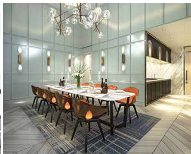
君譽宴會廳設計概念圖