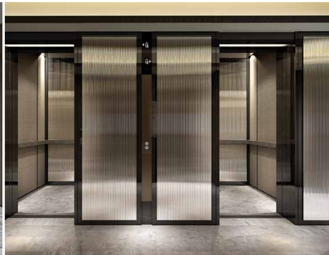
標準樓層電梯設計概念圖

備註：上述之設計概念圖乃設計師的初步構思。賣方保留一切權利，按實際情況需要作出改動，而無須另行通知。上述之設計概念圖經由簡化處理，只供參考。物業之整體設計、佈局或色系皆可能更改，詳細之訂正圖則以政府有關部門批准之圖則為準，所有相關間隔、設計、裝置及裝修物料僅供參考，一切皆以入伙時提供之設備為準。