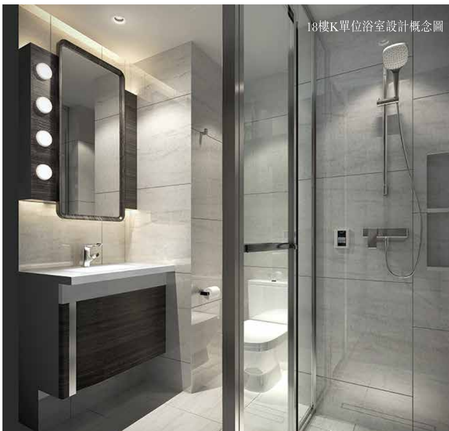
18樓K單位浴室設計概念圖