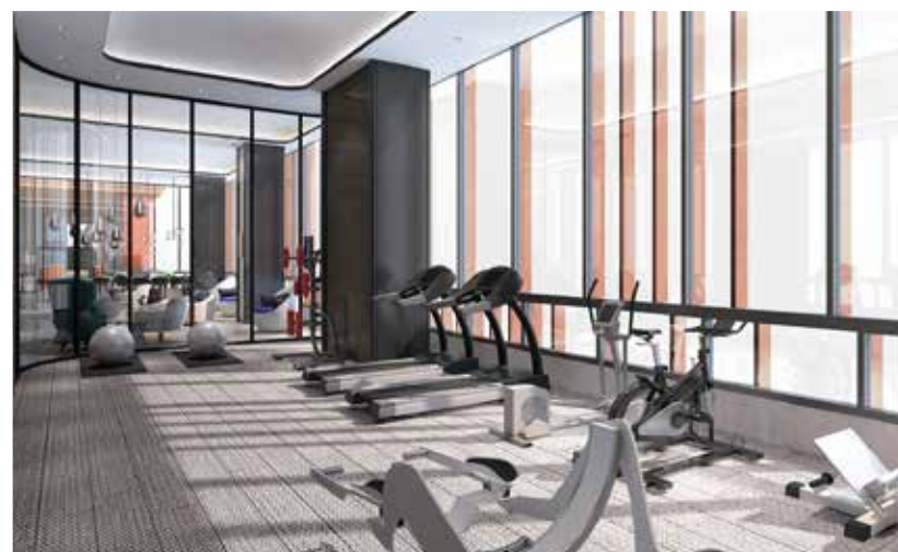
多功能健身室PRO GYM設計概念圖