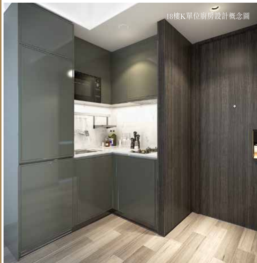
18樓K單位廚房設計概念圖

備註：上述之設計概念圖乃設計師的初步構思。賣方保留一切權利，按實際情況需要作出改動，而無須另行通知。上述之設計概念圖經由簡化處理，只供參考。物業之整體設計、佈局或色系皆可能更改，詳細之訂正圖則以政府有關部門批准之圖則為準，所有相關間隔、設計、裝置及裝修物料僅供參考，一切皆以入伙時提供之設備為準。