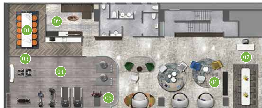
住客康樂設施(二樓)平面圖