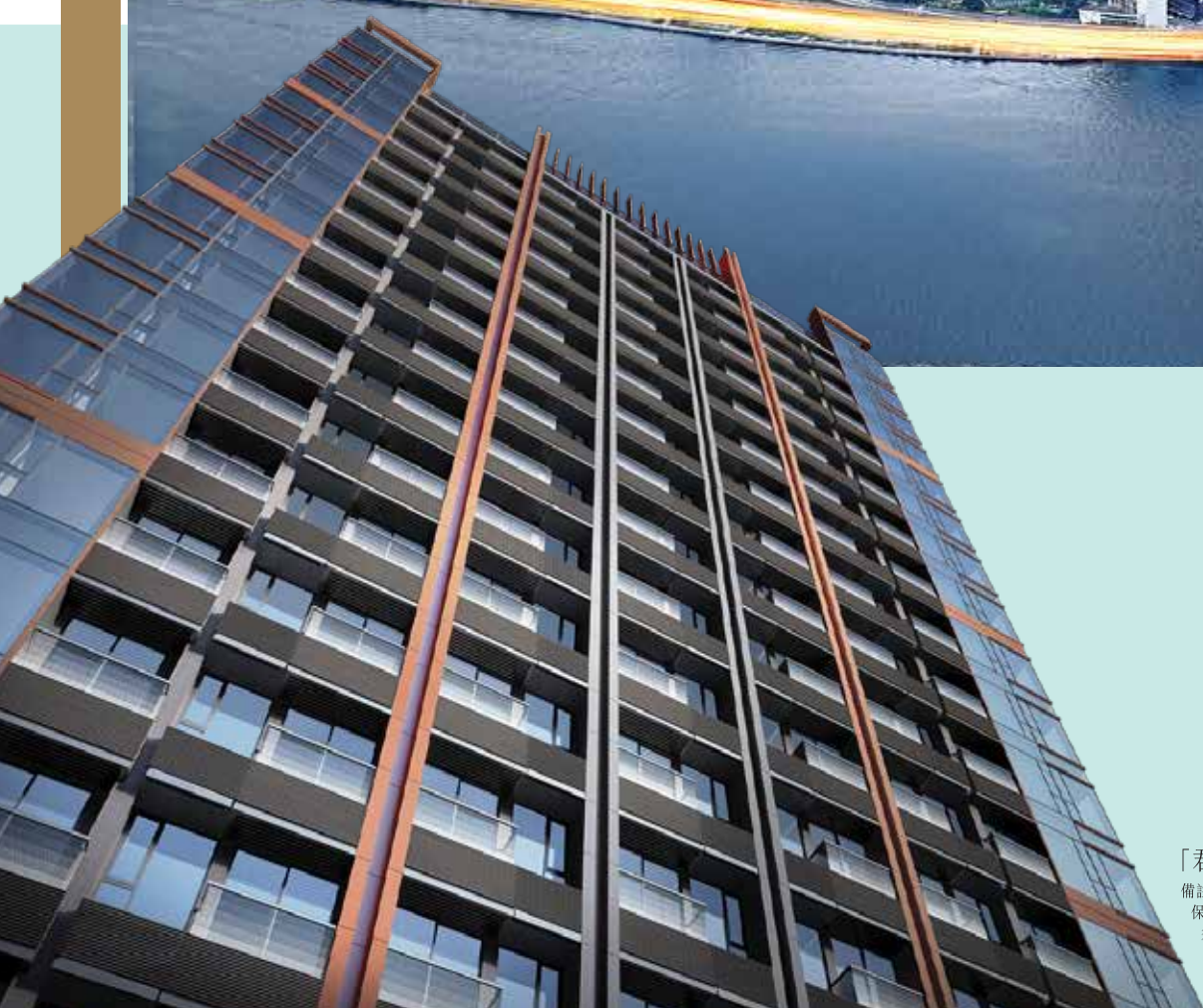
「君譽峰」大廈外觀設計概念圖

備註：此設計概念圖乃設計師的初步構思。賣方保留一切權利，按實際情況需要作出改動，而無須另行通知。